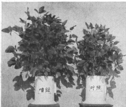
图 2 噴射鉬酸鉍对大豆生长的影响

这一試驗表明,各微量元素在白浆土上对大豆的效益与在黑土上的不同, Zn、Cu 与 Mn 在所施的这种浓度下均屬无效,而 B 可增产 11%, Mo 的效益更大,不論施用方法如何,籽实增产均在 32% 以上,与此有关的生长与产量結構各指标多数都甚为显著。在表征生长的各个指标中,施 Mo 的除浓度为 0.2% 的处理外均增加了株高,并由于总节数增加較多,故叶数亦随之增多(因小金黄品种每节必生一个三小叶的复叶),同时叶綠素的含量也大有提高,因而各器官的干重亦相应大有增加(图 2 及 3)。这些增加,不但为固定 N 素、吸收营养物质及进行光合作用等創造良好条件,也为同时或往后的生殖生长創造良好条件,所以在产量結構上,Mo 不論以何种方法施用,均提高荚数 21—28%,三粒荚(小金黄品种三粒与二粒荚占絕大多数) 25—46%,千粒重 2—8%,因而产量也随着增加 32—49%。