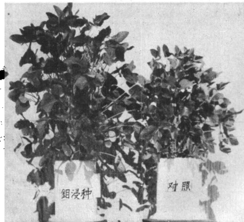
图 3 鉬酸鉍处理种子对大豆生长的影响

Mo 在 N 素代謝中的积极作用,已为人們所熟知,特别是它对固氮与硝酸还原,近年已有較深入的研究,并已积累相当多的資料 [2-5] ,根据本試驗及前述各試驗,施 Mo 一般提高