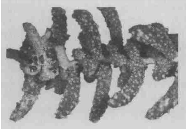
图1 琵琶柴叶片盐分颗粒(×20)