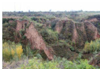
图13 沟壑 Fig. 13 Gully