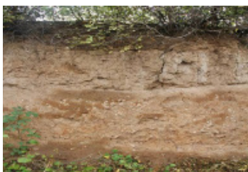
图12 古人类活动迹象 Fig. 12 Traces of ancient human activities