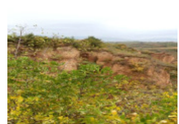
图11 坡地 Fig. 11 Slope