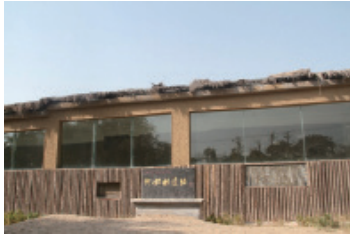
图3 仰韶村遗址保护墙场馆 Fig. 3 Yangshao village site protection wall