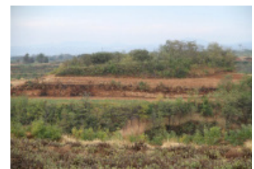
图14 农地 Fig. 14 Farmland