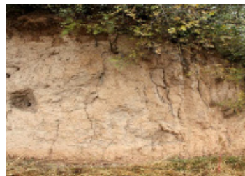
图10 古人类活动迹象 Fig. 10 Traces of ancient human activities