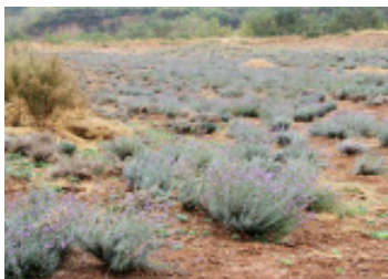
图9 薰衣草 Fig. 9 Field of lavender