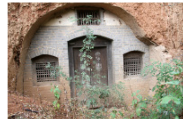
图8 废弃窑洞 Fig. 8 Deserted cave-houses