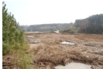
图7 水塘 Fig. 7 Pond