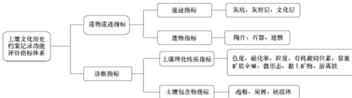
图1 土壤文化历史档案记录功能评价指标体系

遗物遗迹指标侧重其是否存在，诊断指标侧重其数值是否达标，采用定性与定量相结合的方法，建立评价标准。由于遗物遗迹科研价值明显，所以其重要性大于诊断指标，而遗迹与遗物相比，土壤科研价值明显，所以遗迹指标的重要性大于遗物指标。据此将土壤文化历史档案记录功能划分为六个等级：一级表示功能完整，需重点保护，具体评价标准为发现所有遗物遗迹指标，且数量丰富，是考古学家和土壤学家共同研究的珍贵科研对象，考古学家可通过研究丰富的遗物遗迹推断古人类产生