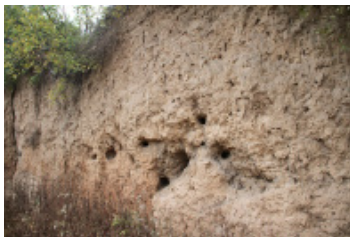
图6 被破坏的文化层 Fig. 6 Damaged cultural layer