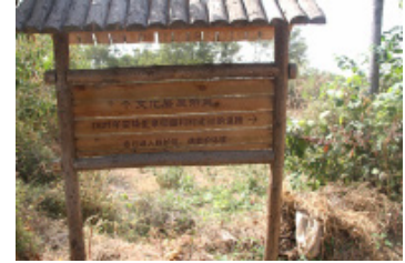
图5 旅游线路安特生小道 Fig. 5 Andersson path for travellers