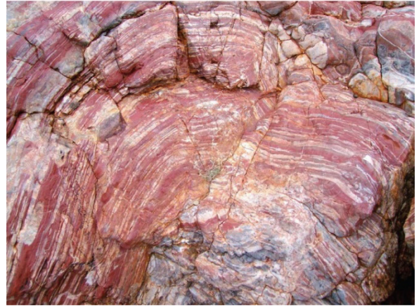
图 3 25 亿年前鲜红色岩石与“古土壤”（澳大利亚 Pilbara 地区） [11]