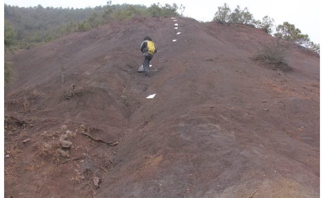
图5 出露地表的~260 Ma 前玄武岩强烈风化形成的厚层古土壤(云南昭通)

近年来, 位于低纬度地区基性岩、超基性岩的大规模强烈风化成土作用, 因其含斜长石、辉石、橄榄石等含 Ca、Mg 造岩矿物与大气 \text{CO}_2 反应而分解, 在形成土壤的同时消耗大量 \text{CO}_2 (图5) [19] 。相对其他硅酸盐岩, 作为基性岩代表性岩石类型的玄武岩风化速率快, 消耗 \text{CO}_2 量约为全球硅酸盐岩消耗 \text{CO}_2 量的三分之一, 可调节全球气候, 促进宜居地球演进。为缓解全球环境变化, \text{CO}_2 捕集、利用和封存技术受到广泛重视。而硅酸盐岩风化成土过程增汇作用可视为碳中和技术的理论基础之一, 现已开展农田施用玄武岩试验研究, 且表明具有可行性 [20] 。