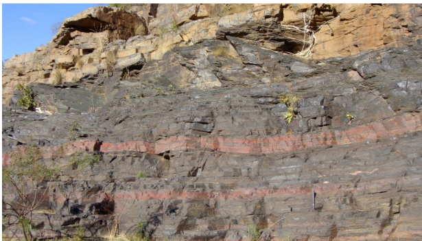
图 2 Crowe 等 [7] 研究的一些岩石与 30 亿年前古风化壳 Fig. 2 3.0 Ga red rocks and paleo-weathering-crust studied by Crowe S A, et al [7]

地质学家报道最老的“土壤”出现在约 37 亿年前 [10] 。这类前寒武纪时期“古土壤”虽难识别，但通常具有一些特点：一般位于地层不整合面，且具有一定的土壤结构。同时，尽管此时大气氧含量低，但化学风化作用仍较强烈，既有水解作用，也有碳酸淋溶作用 [3] ，可促使长石和绿泥石等矿物分解、Al/Ti 和 Si/Ti 比值下降以及元素 Al、Si 亏损。同时，岩石化学风化强度和特征以及“古土壤”发生特性极大地受古大气氧含量影响，特别是对氧化还原环境敏感的 Fe、V、Cr、Ce 等变价元素价态受当时大气中氧含量控制。当 Fe^{3+}/Fe^{2+} 增高、发现富 Fe^{3+} 黏土矿物出现，则指示大气氧含量有所增长；而鲜红色岩石（古风化壳）出现就是大气氧含量激增，例如大氧化事件的典型标志（图 2、图 3） [7, 11] 。