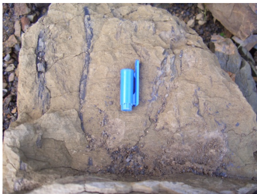
图4 中生代古土壤及其中植物根系痕迹(四川龙泉驿) Fig. 4 Mesozoic paleosols and root traces (Longquanyi, Sichuan)

地质历史时期土壤的形成具有划时代意义, 并最终进入了现知其他行星所没有的高等生命与自然和谐共生、生态系统繁荣昌盛的特殊境界, 为人类文明的兴起和发展奠定了基础: 供给绿色植物生长所需水分、养分, 为植物生长提供机械支撑, 降解环境污染物, 保持微生物的生物多样性等等, 为陆生维管植物在陆地表面着生的大转变提供了前提。随着树木状植物和种子植物的相继出现, 到晚泥盆世, 植物已经占据了干燥严苛的高地陆生环境, 成了主宰地球陆地生态系统最重要的力量之一。与此同时, 土壤也紧随植被的演化而加速形成与发育进程, 这是地球上植物界和土壤界的第一次大发展(图4)。随土壤形成与持续演化, 土壤的生态功能逐渐强化。泥盆纪中期随着乔木出现, 植被光合作用增强, 生物固碳效应大幅度提升, 导致大气中 \text{CO}_2