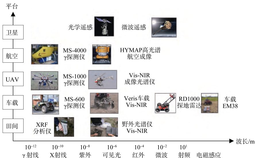
图2 现代土壤调查数据获取平台特征